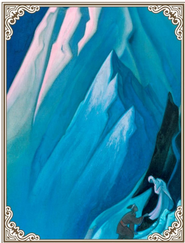
Н. К. Рерих. Ведущая, 1944 г.