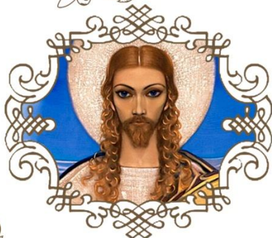
С.Н. Рерих Возлюби ближнего своего, 1967 г.