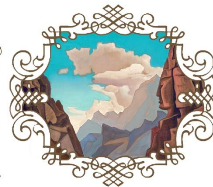
Н.К. Рерих Великий Дух Гималаев, 1934 г.