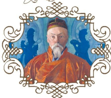
С.Н. Рерих Н.К. Рерих, 1928 г.