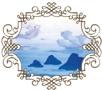
Н.К. Рерих Превыше гор, 1924 г.