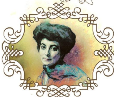
В.А. Серов. Е.И. Рерих. 1909 г.