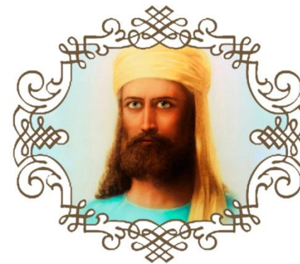
Учитель Мориа, давший миру через Е.И. Рерих Учение Живой Этики или Агни-Йогу

Е.И. Рерих по праву можно назвать Прометеем XX века. Великие Учителя назвали её Матерью Агни-Йоги, так как она приняла это Учение Жизни. “Как Огонь является все связы- вающим началом, так Агни-Йога проникает всю жизнь”, - гово- рится в нём, и далее - “Можно сравнить Агни-Йогу со Звездой Утра, которая возвещает близость света”.